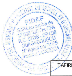
TABLEAU FINANCIER DES RESSOURCES ET DES EMPLOIS (TAFIRE)